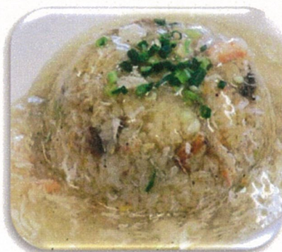
あんかけチャーハン