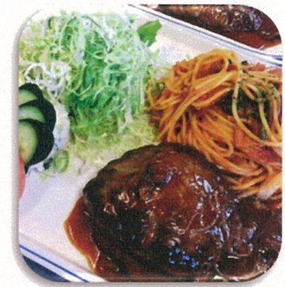
万理加特製ハンバーグセット