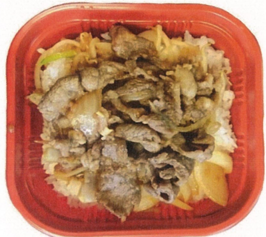
ジンギスカン丼 500円