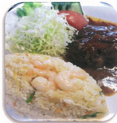
ハンバーグピラフセット