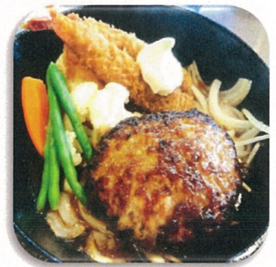
ハンバーグエビフライセット