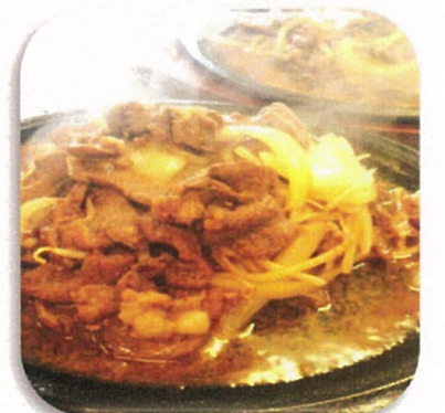
ジンギスカン定食