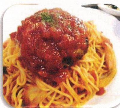
ハンバーグナポリタン